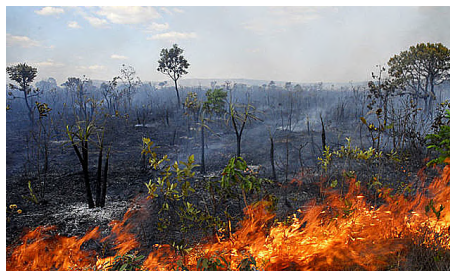
O Estado da Bahia liderou com um aumento de 38%

O Ministério do Meio Ambiente reconheceu o Cer-